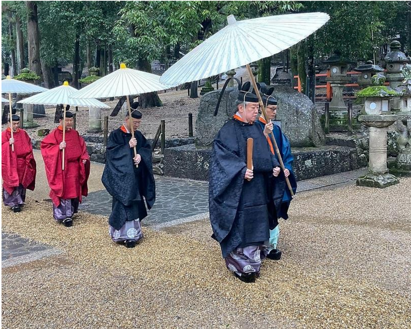
Kasuga Festival Mito Openingsceremonie