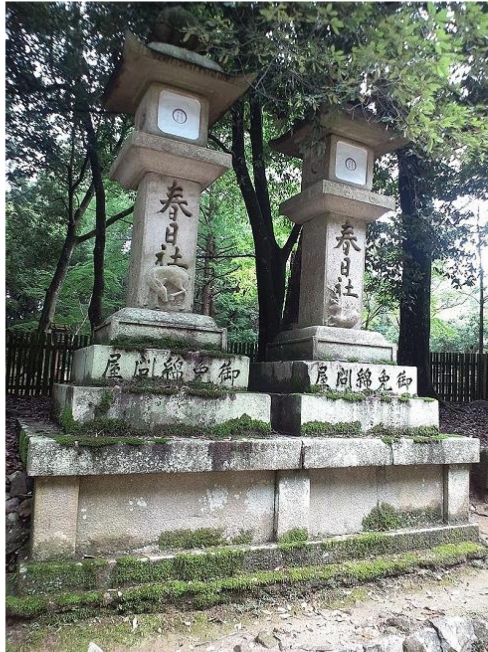
Stenen lantaarns, benadering van een Schrijn