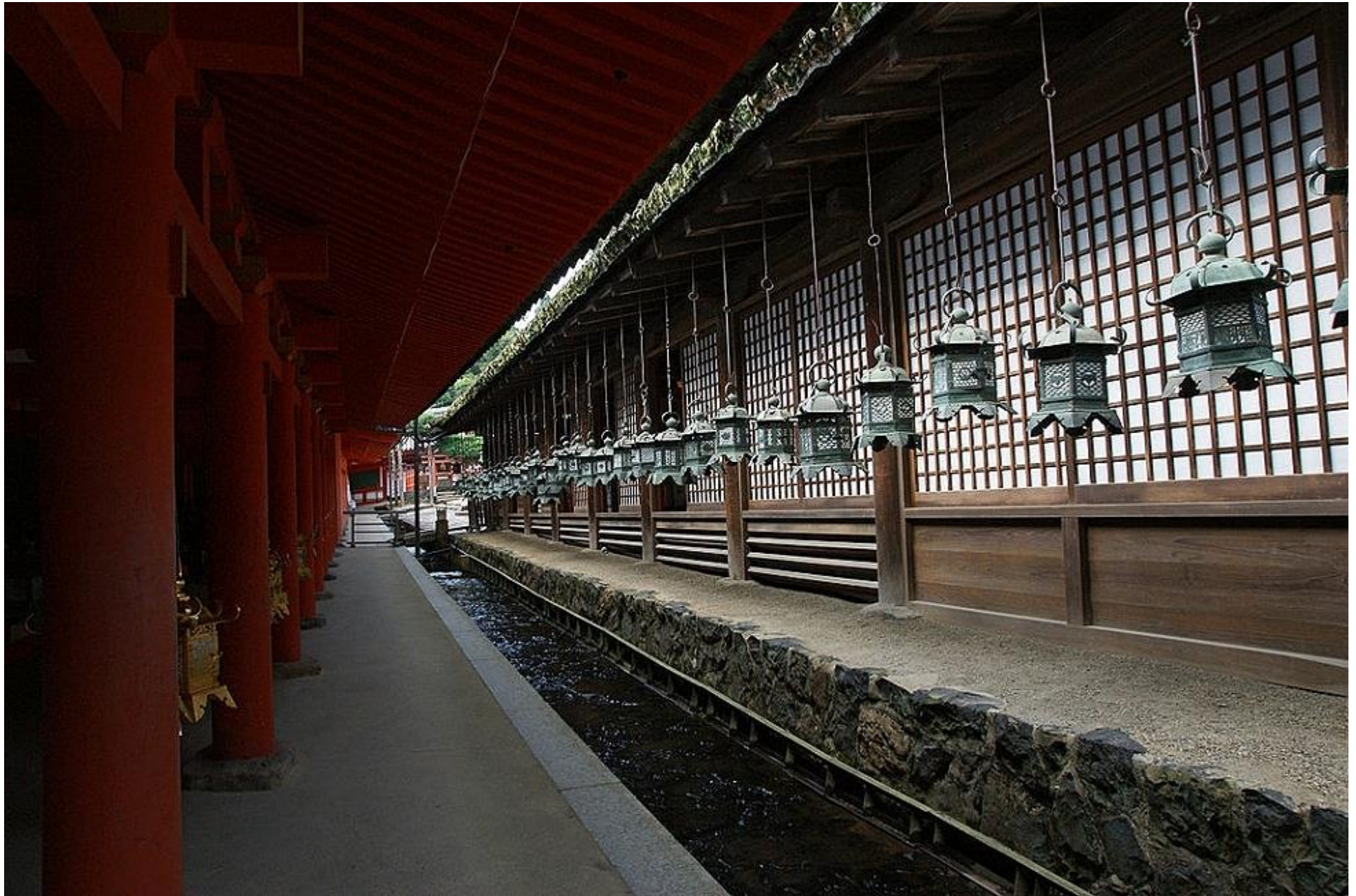
West Gang en Ontmoetings Hal