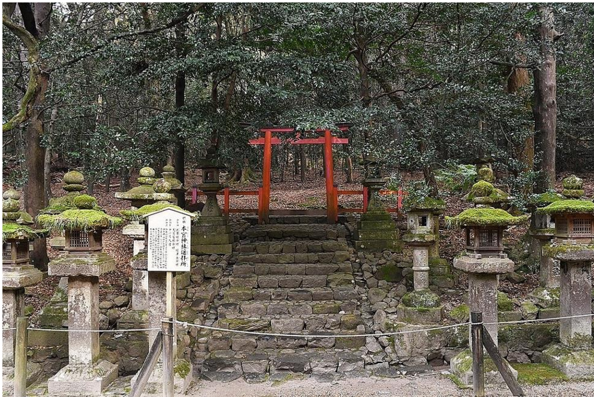
Hongu-schrijn Plaats van Gebed