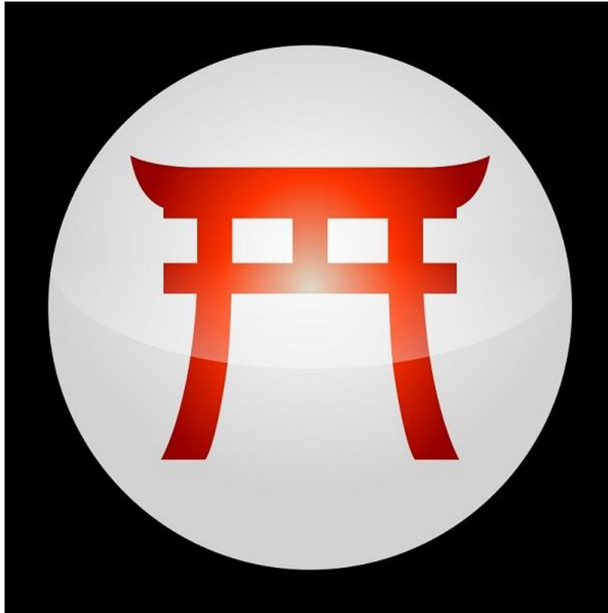
Icoon van Shinto