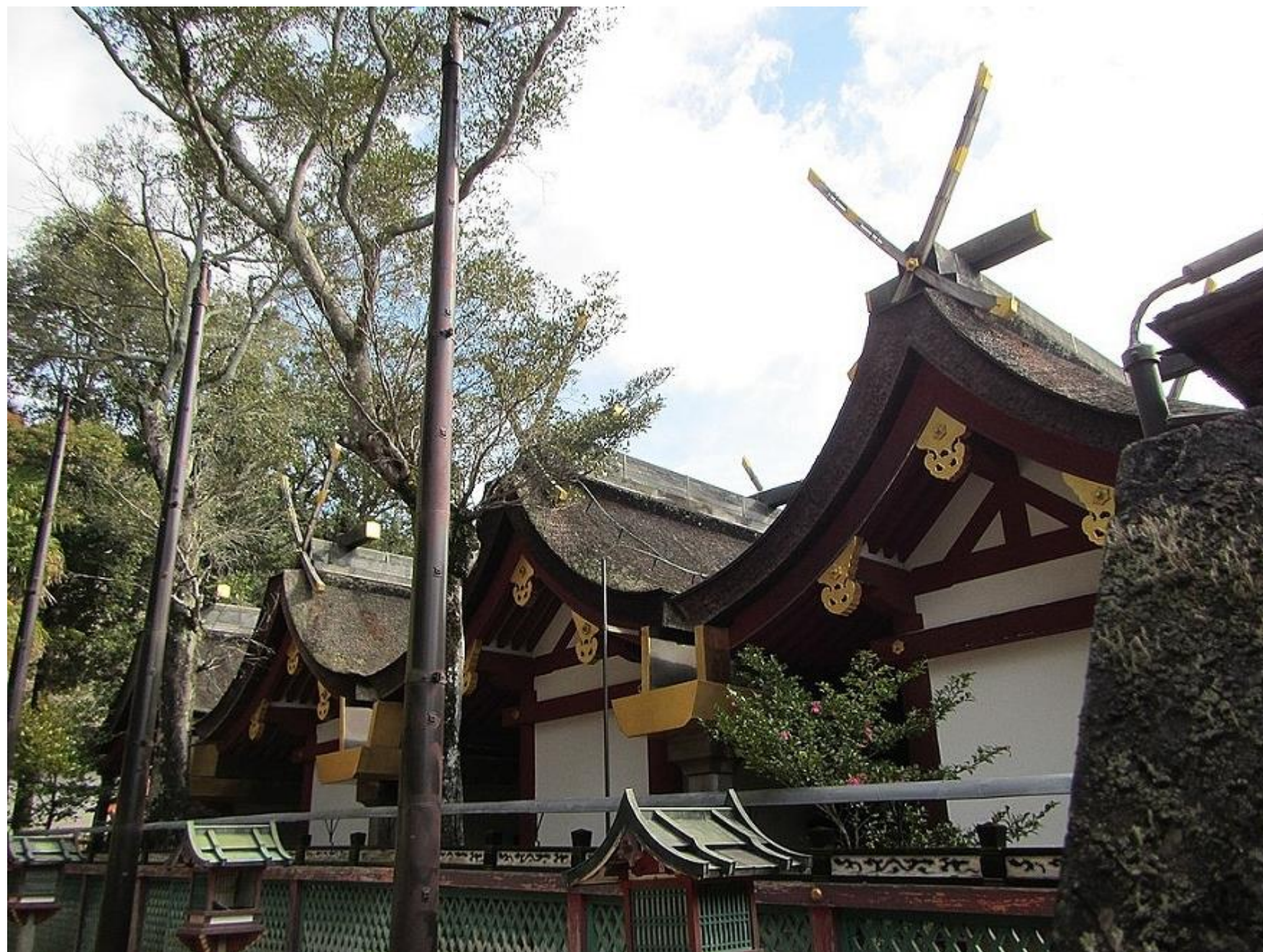
Grote zaal (achterzijde) Van voor naar achter: 4e hal, 3e hal, 2e hal, 1e hal