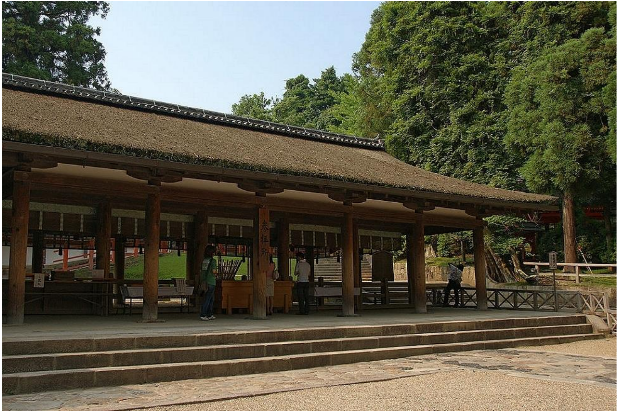
Offer & Japanese Dans Uitvoer Hal