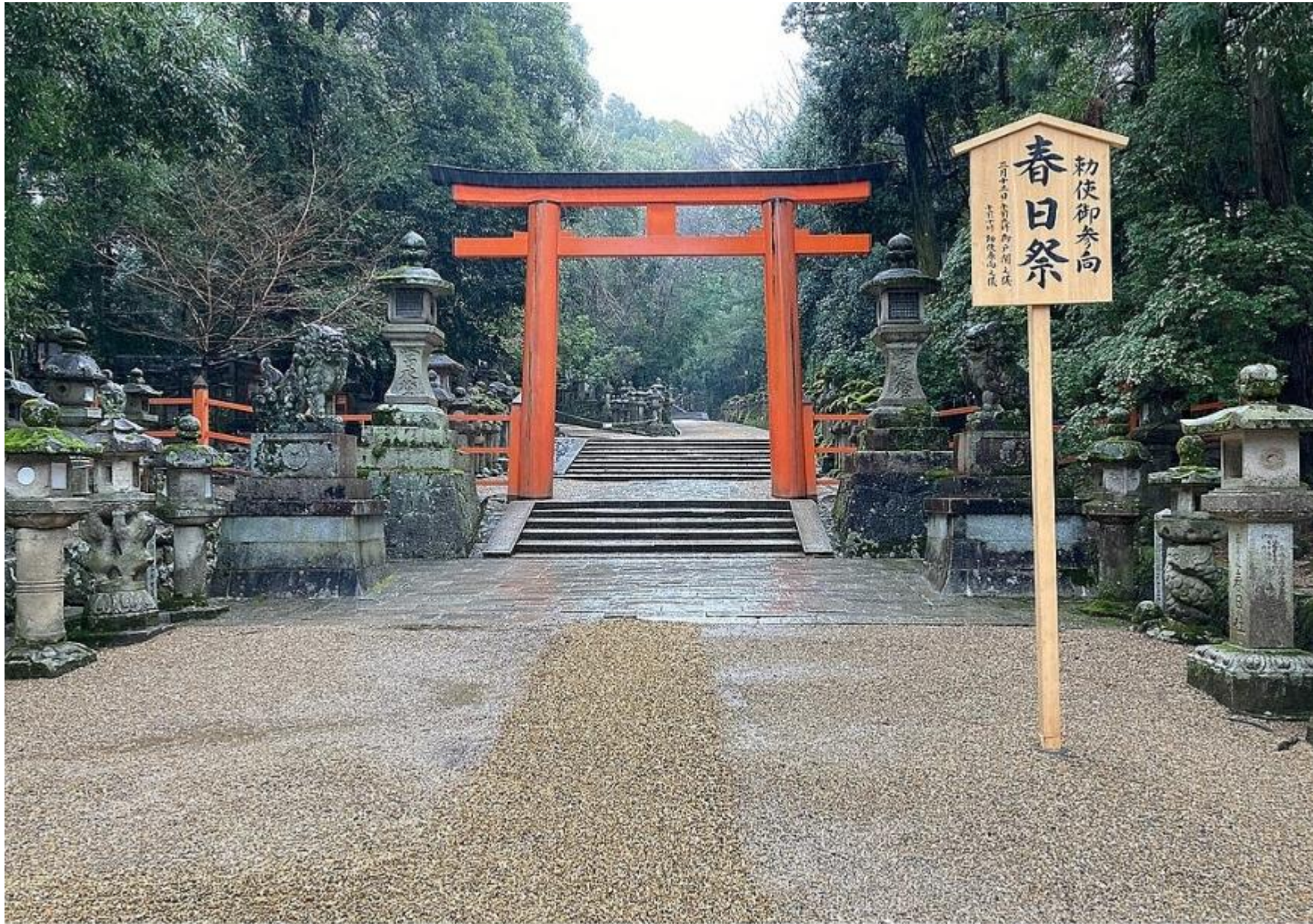
Tweede Torii Poort