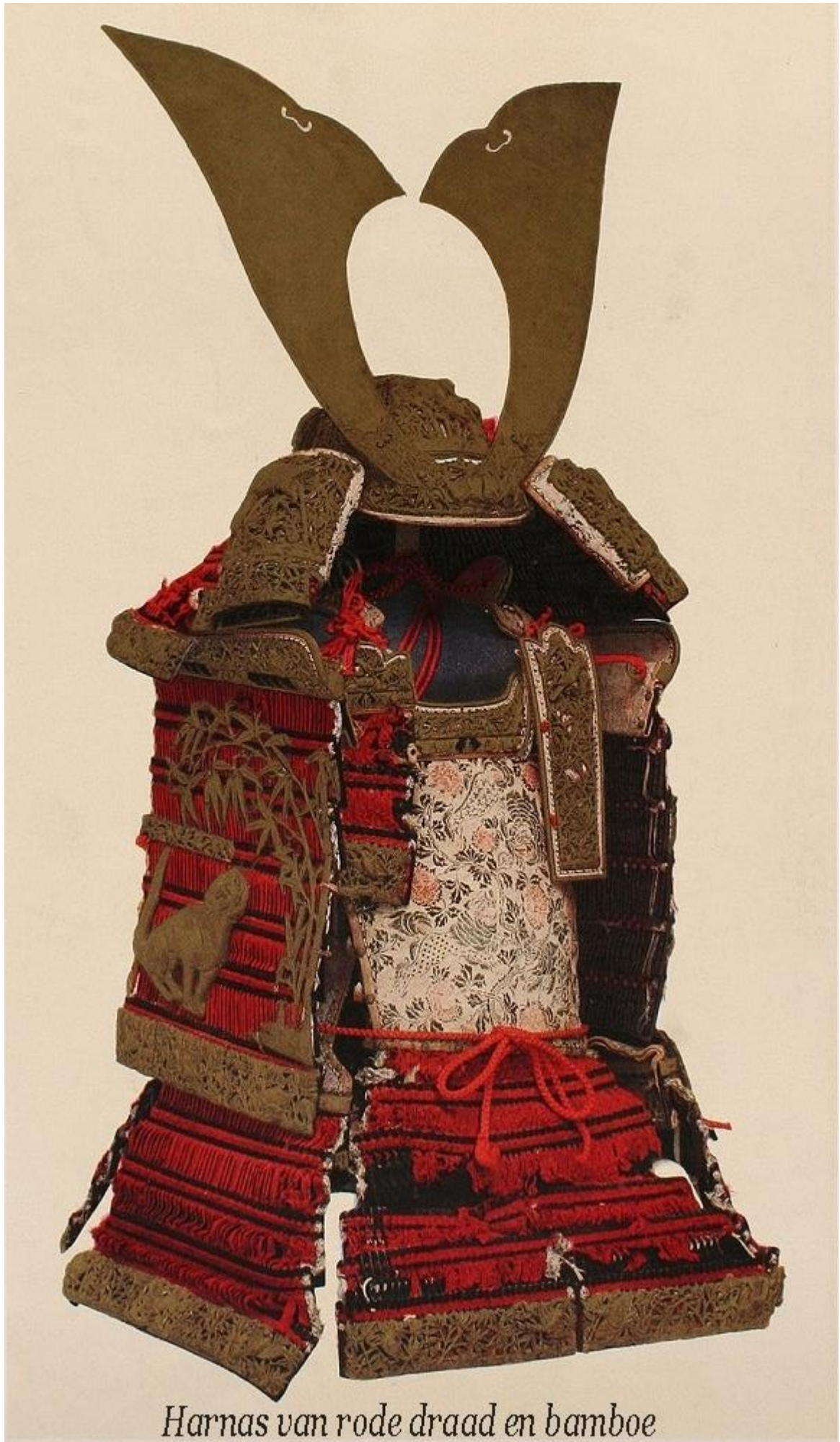
Harnas van rode draad en bamboe