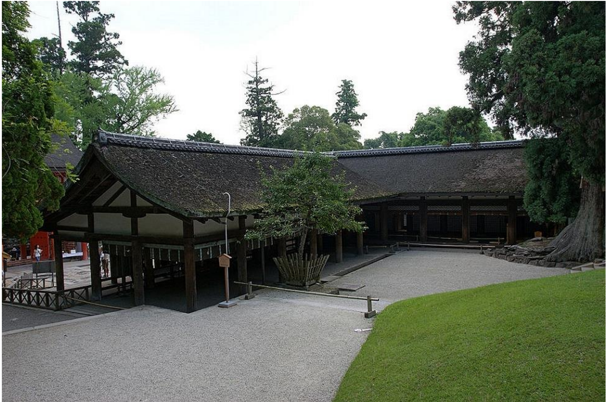
Offer, Dans & Ontmoetings Hal