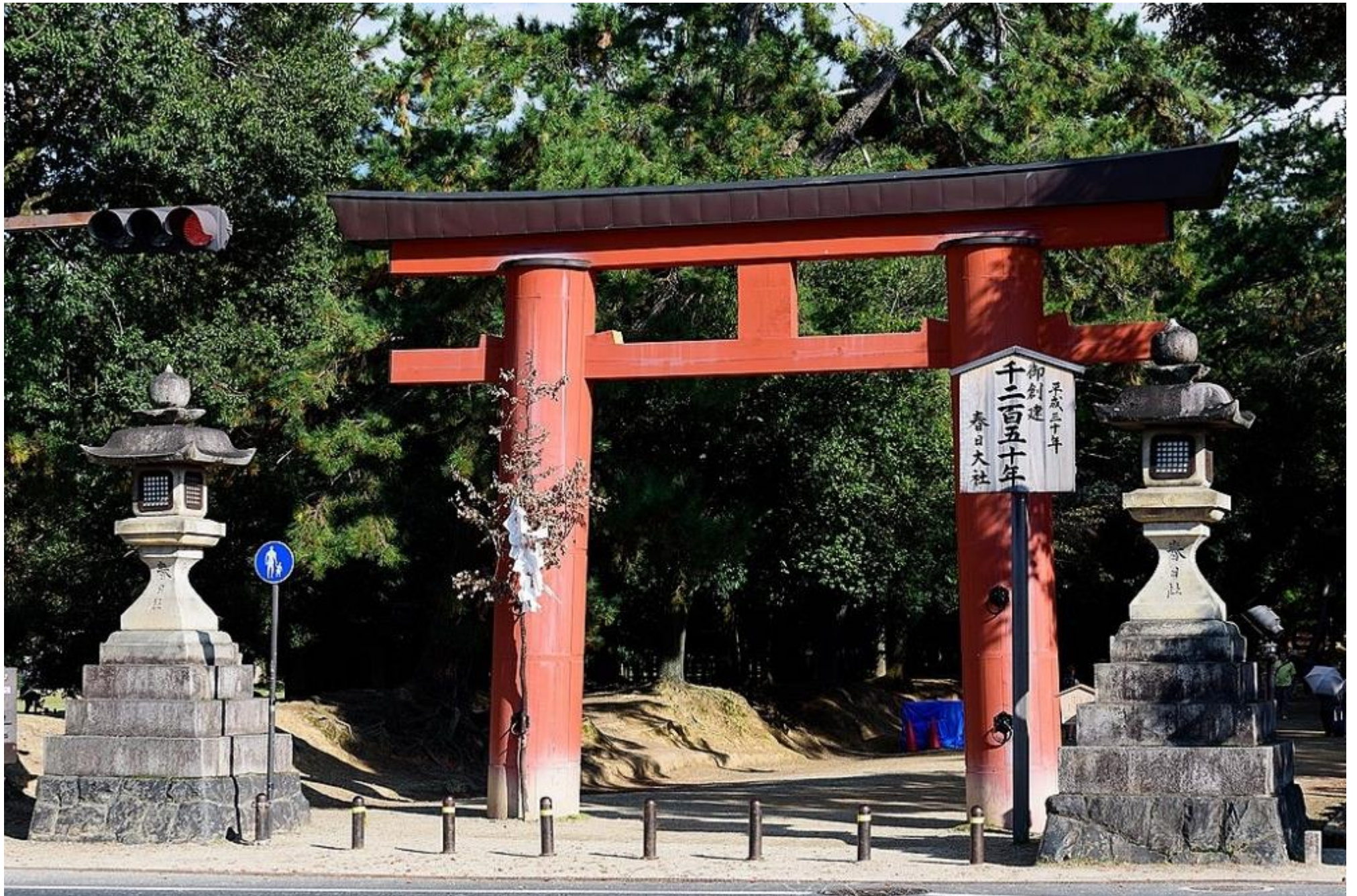
一の鳥居 Eerste torii-poort