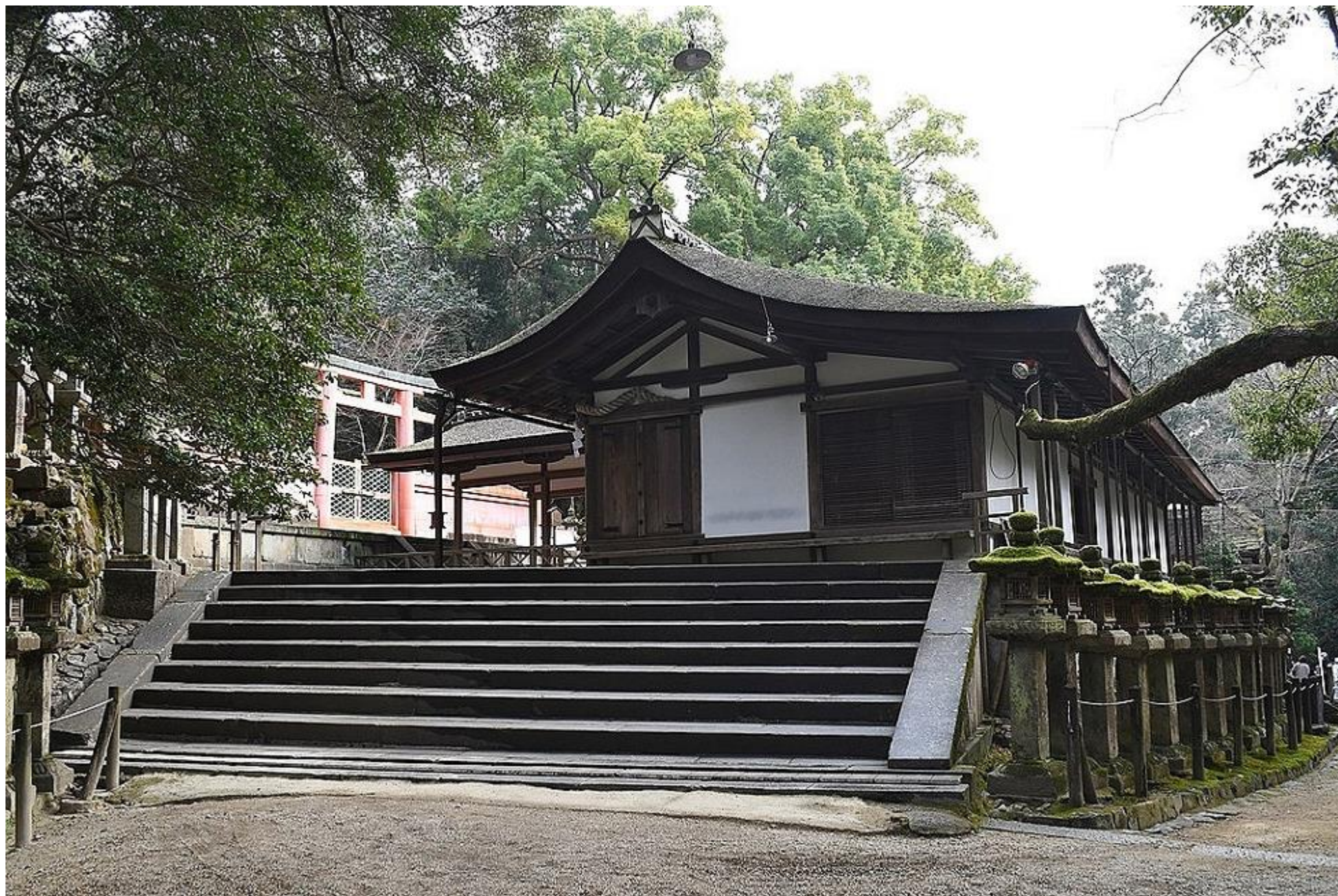
Wakamiya-Schrijn Eredienst Hal