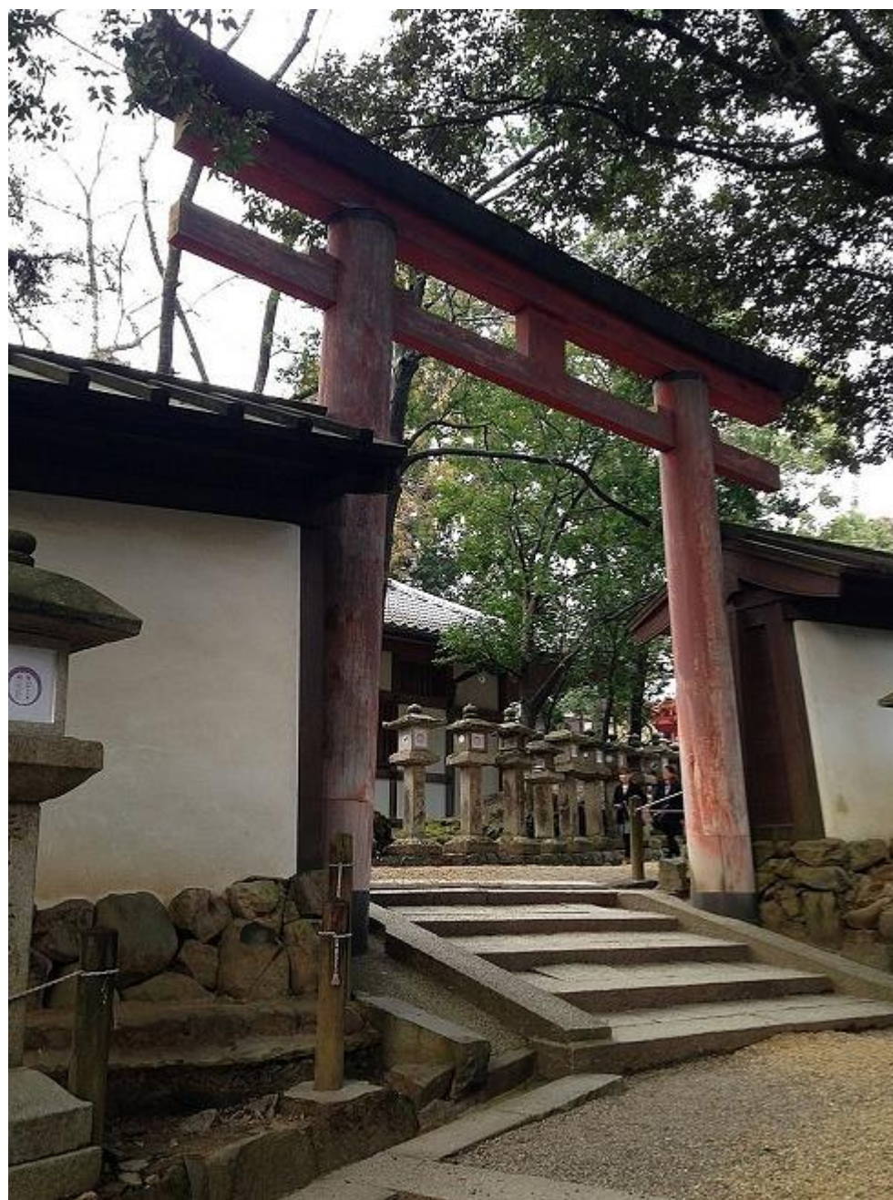
De "Fuji Torii" (was ooit alleen toegankelijk voor mensen van de Fujiwara-clan)